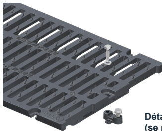
Détail du dispositif de chaînage (se référer à la fiche technique dédiée)